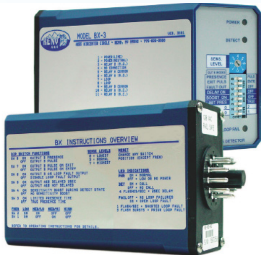
MEDIDAS: 7.62 CM DE ALTURA X 4.44 CM DE ANCHURA X 10.92 CM DE PROFUNDIDAD