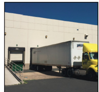
PUERTAS ENROLLABLES DE ALTA VELOCIDAD