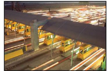
AUTOPISTAS DE PEAJE